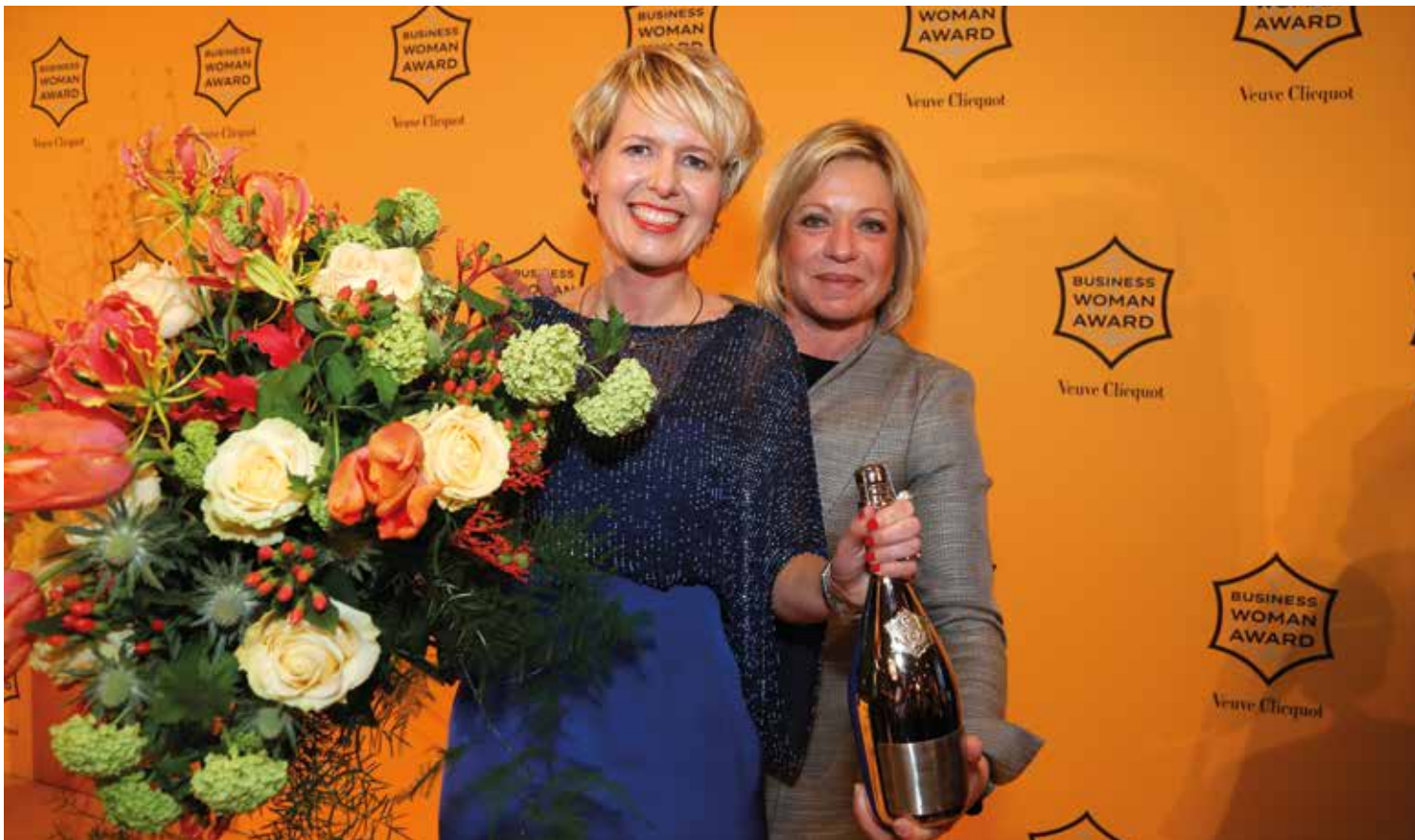
Prijzuitreiking Zakenvrouw van het Jaar 2017 door voormalig minister Jeanine Hennis-Plasschaert.

gang komen. Die vergroten de druk op 's werelds mooie plekken zodanig, dat het wel prijsverhogend moet gaan werken om de toestroom te beperken. Je zult moeten accepteren dat veel van wat wij doen per definitie niet duurzaam is, maar het zal je verbazen dat ze in de hospitality in de VS en Canada vaak veel verder zijn met duurzaamheid dan wij. Zelfs in het overvloedige Las Vegas, waar de grote resorts enorm "groen" bezig zijn. Bijvoorbeeld als het gaat om waterrecycling en duurzame energie. Ze zijn daar veel rigouzeuzer, ze knallen een heel blok weg en zetten daar iets neer wat aan de hoogste milieustandaarden voldoet.'